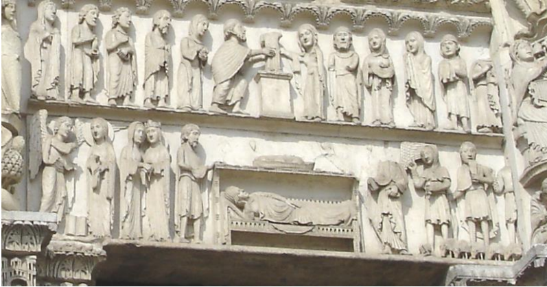
Königsportal Chartres: Maria im Wochenbett eine Hand am Ohr, eine auf dem Bauch; Jesus in einem Schiff

Du hörst, nimmst auf, gleich müsst ihr fort, gebierst, hältst ihn, das göttlich Wort: Das Wort, Dein Fleisch, entreißt man gleich, und spricht vom Herrn im Weltenreich. Den Hirten ist er Guter Hirt, den Königen Herzenskönig wird, dem Gold, Rauch, Myrrhe sind bestimmt, weil gleich er andren Platz einnimmt. Die Schiffsfracht wird zur Opferfrucht, die Kreuzesaltars Höhe sucht.