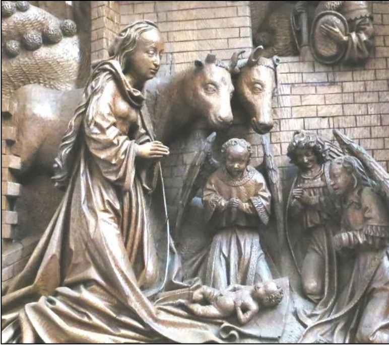
Marienaltar St. Nicolai Kalkar