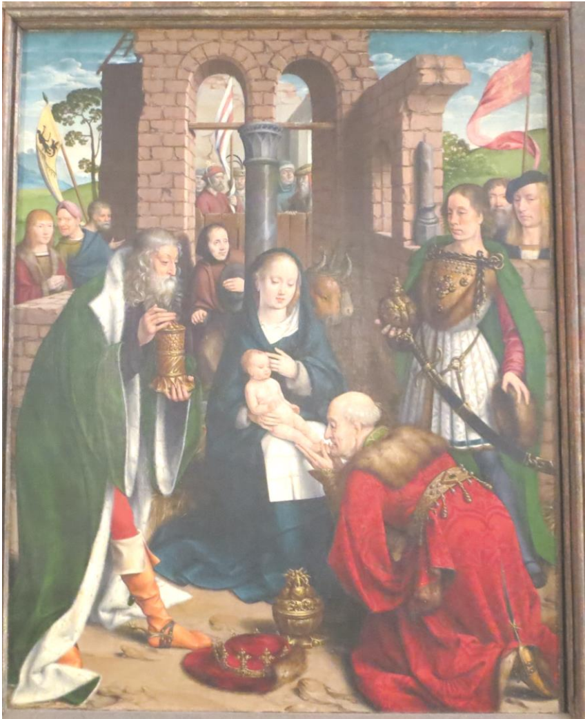
Jan Joest, Anbetung der Könige. St. Nicolai, Kalkar 1510