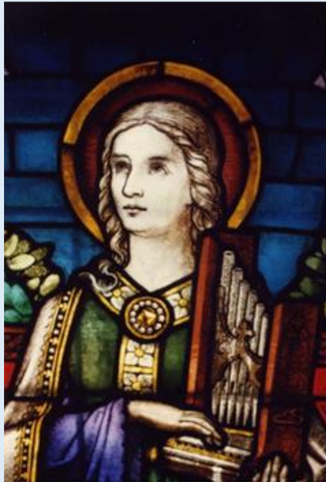
Hl. Cäcilia, Patronin der Kirchenmusik