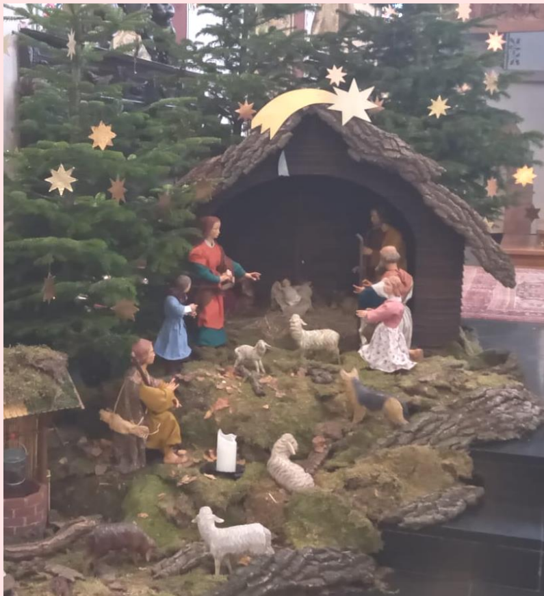
Krippe 2020 – St. Peter u. Paul, Grieth