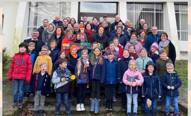
Eindrücke vom Wolfsberg Wochenende