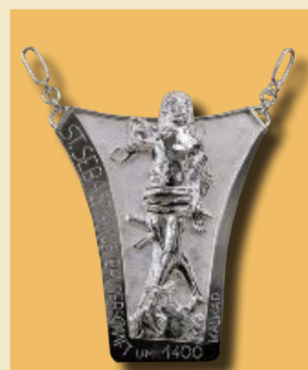
Brustschild der Stola des Fähnrichs seit 2017

Am Patronatsfest treffen sich die Brüder im Hochchor der Kirche zu einem feierlichen Gottesdienst, zu dem auch Offiziere der anderen Bruderschaften geladen sind. Nach gemeinsamem Frühstück werden die Belange der Bruderschaft beraten und beschlossen. Am Abend des gleichen Tages treffen sich die Brüder zu einem Festabend.