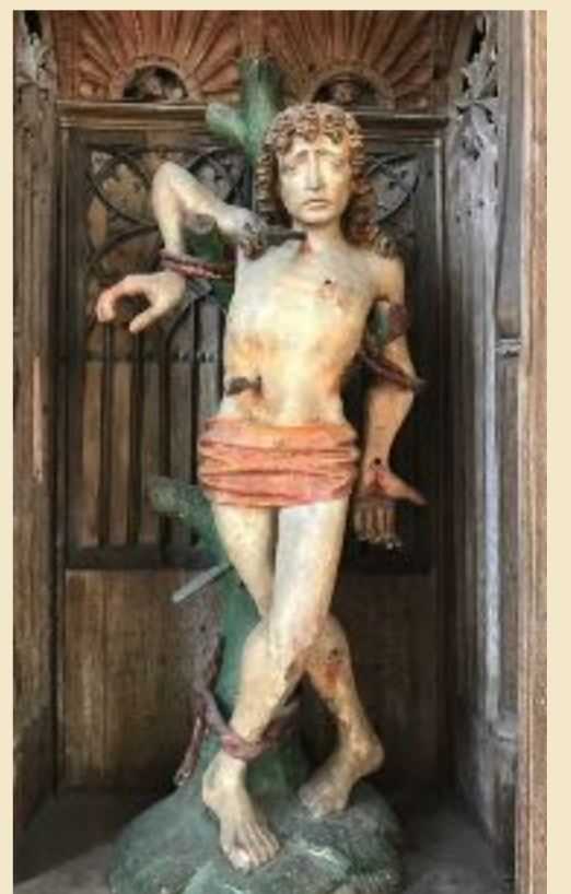
Sebastianusfigur in der Antoniuskirche Hanselaer