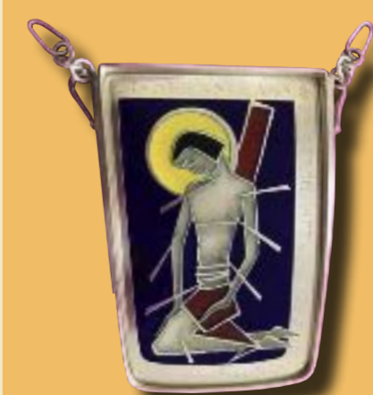
Brustschild der Stola des Fähnrichs bis 2017